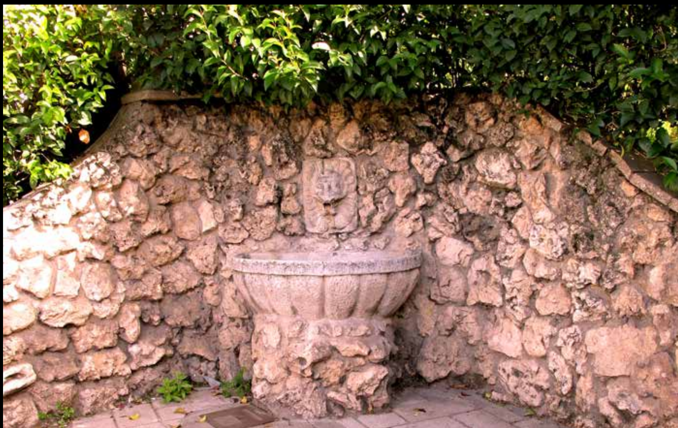
● Fuente de la calle Juan XXIII