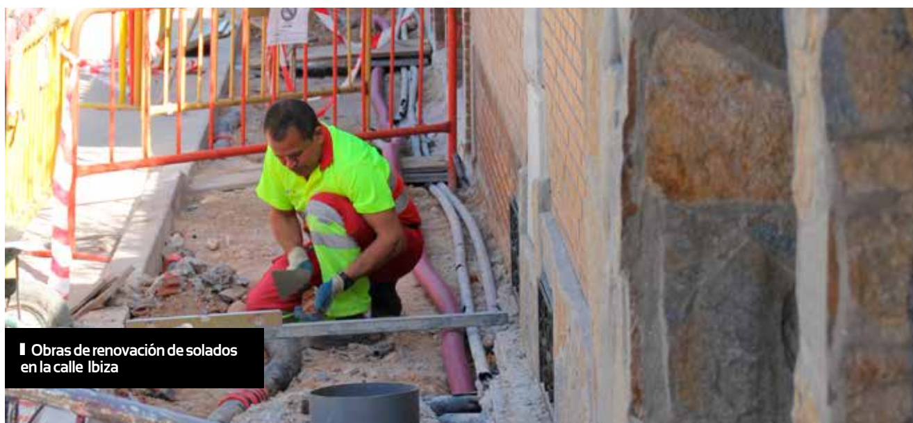
▮ Obras de renovación de solados en la calle Ibiza