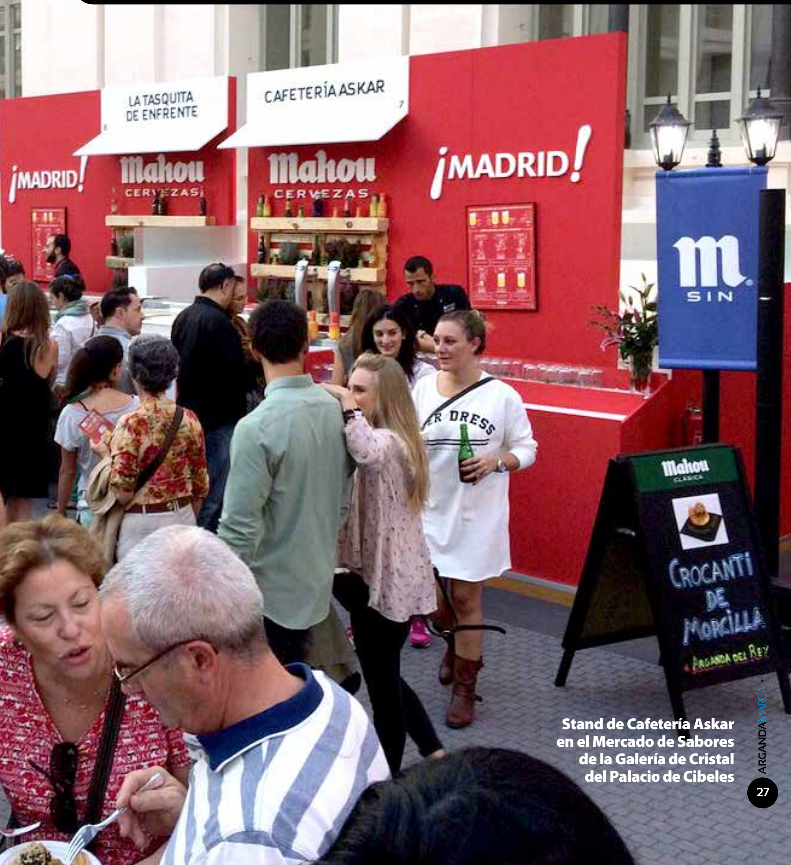
Stand de Cafetería Askar en el Mercado de Sabores de la Galería de Cristal del Palacio de Cibeles

Askar no solo ha ganado las tres últimas ediciones de la Ruta de la Tapa de Arganda del Rey, sino que también consiguió, con la tapa ganadora de la Ruta del 2013 (Crocanti de morcilla rellena de dátil sobre tosta de cebolla confitada con salsa de naranja y perla de fruta), el primer premio en el Campeonato de la Tapa de la Comunidad de Madrid. Este hecho le otorgó el pasaporte directo para poder participar en el Mercado de Sabores 2014 el pasado 23 de octubre, un certamen en el que tuvieron que enfrentarse a otras tapas de alta cocina, algunas de ellas, incluso, con estrellas Michelin.