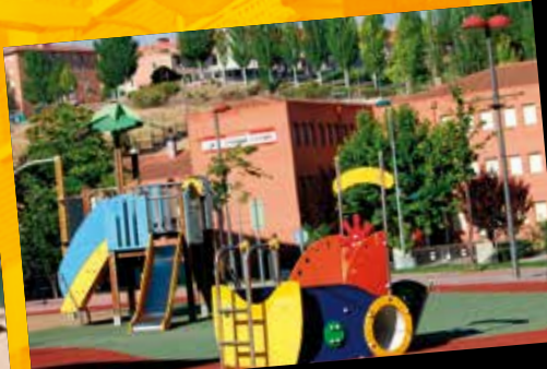
Área infantil Plaza de Colón