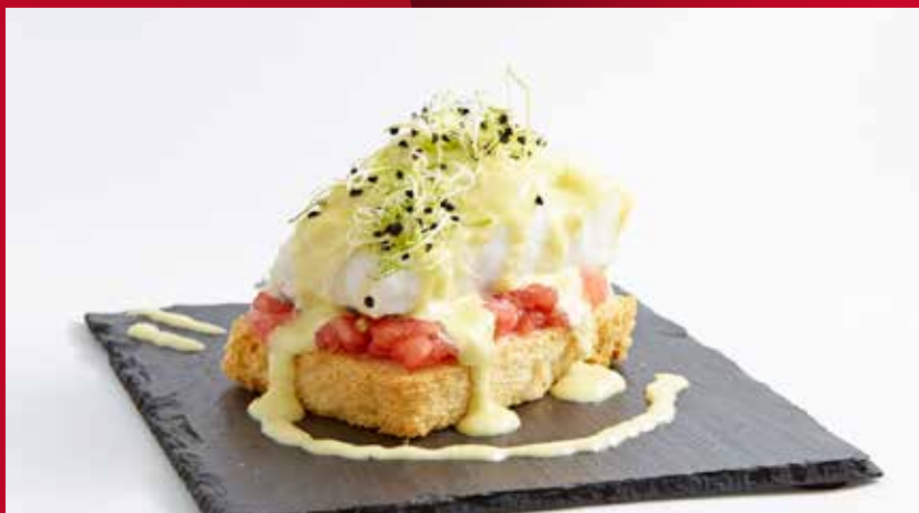
LINGOTE DE BACALAO CON ALI OLI DE MIEL Y MERMELADA DE TOMATE

Este año, además de la placa al ganador, se han entregado dos diplomas. Uno a D'París, que ha