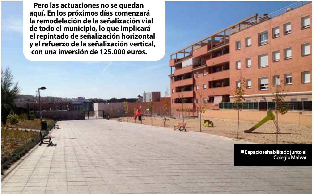
● Espacio rehabilitado junto al Colegio Malvar

Pero las actuaciones no se quedan aquí. En los próximos días comenzará la remodelación de la señalización vial de todo el municipio, lo que implicará el repintado de señalización horizontal y el refuerzo de la señalización vertical, con una inversión de 125.000 euros.