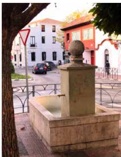
■ La segunda fuente del Ave María

a finales del XVIII o principios del XIX. El pleno municipal del 26 de septiembre de 1896 acordó trasladarla, pero en 1897 lo que se hace es construir una nueva, en la ubicación actual, pero con el pilón más largo para que pudiesen abreviar varios animales. La que hoy conocemos como fuente del Ave María es igual a la de 1897 pero con el pilón recortado para que pueda pasar el tráfico."