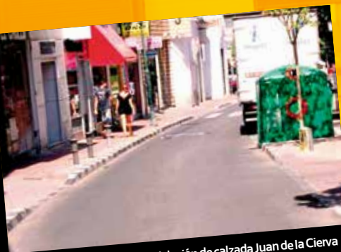
Remodelación de calzada Juan de la Cierva