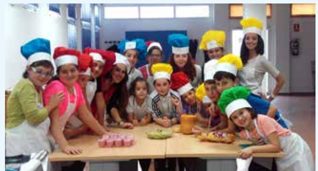
Algunos de los niños y niñas participantes en este II Taller de Cocina

A lo largo de las cinco sesiones, se abordarán propuestas para desayunos y meriendas saludables, cocina monocromática, cocina del mundo, elaboración de masa para pan, galletas o lasaña, y elaboración de un menú de fiesta.