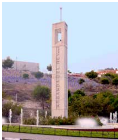
■ Fuente de los Almendros