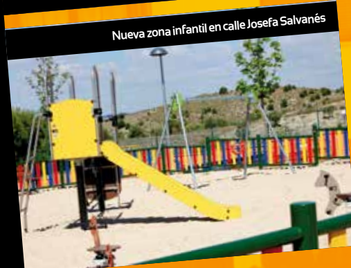
Nueva zona infantil en calle Josefa Salvanés