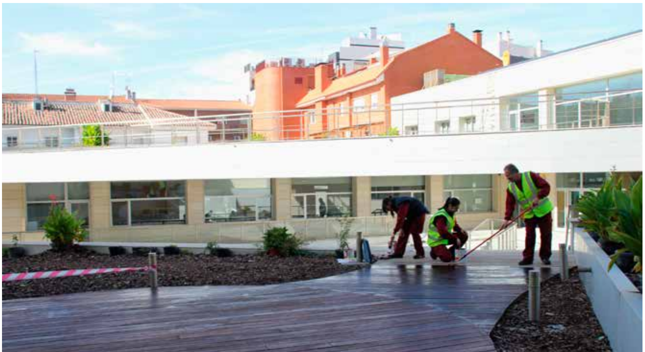
Trabajadores del IV Plan de Empleo haciendo labores de mantenimiento en el Centro de Mayores

Y para esta cuarta edición, se añaden, además, dos puestos más: los de auxiliares de información, que también se encuentran ya desarrollando su trabajo en las instalaciones municipales.