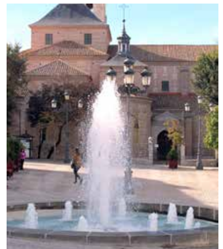
■ Fuente de la Plaza de la Constitución