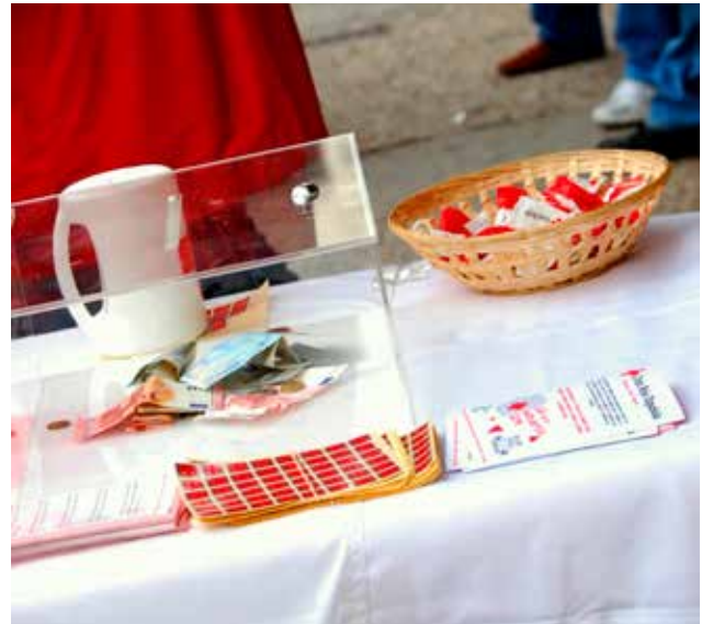
■ Mesa de Cruz Roja instalada en la Plaza de la Constitución.

Lo recaudado en esta campaña se va a dedicar íntegramente a los programas de Promoción del Éxito Escolar dirigidos a atender las necesidades de unos 66.000 niños de nuestro país. Con estos proyectos, Cruz Roja ofrece material educativo, actividades extraescolares, bolsas de merienda y material escolar.