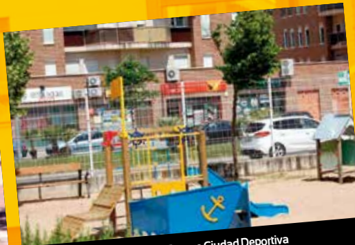
Barco Malta en Parque Ciudad Deportiva