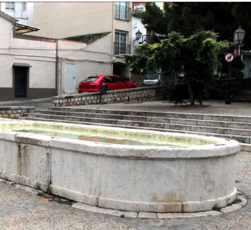
■ La elegante y neoclásica Fuente Nueva