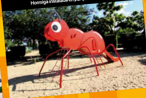
Hormiga instalada en parque lo de Mayo