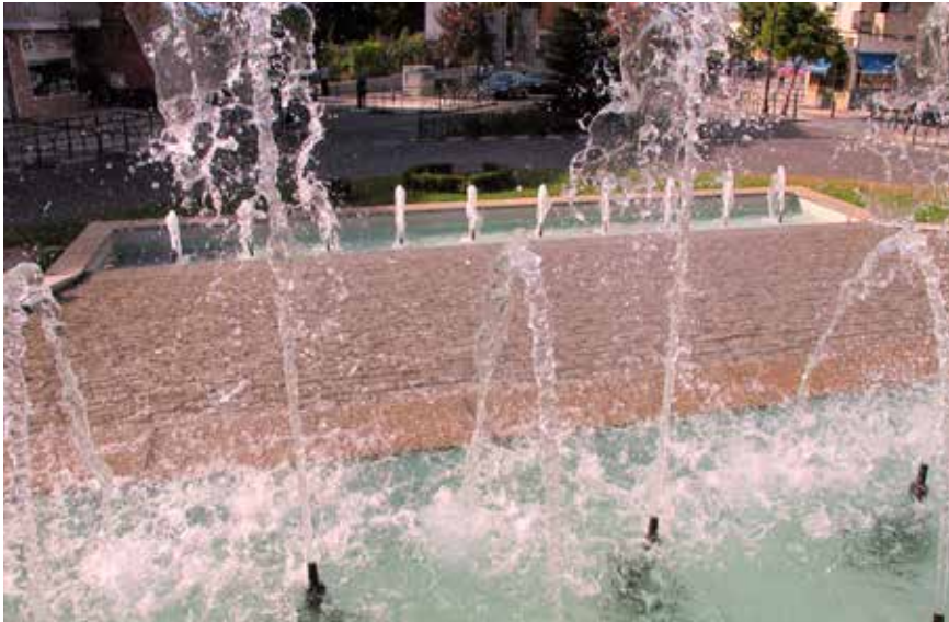
■ Fuente de la Plaza de Extremadura

Y la insólita "fuente descabellada" de la plaza de la Constitución a la que todos los años se le da la puntilla y desaparece durante unos días para que bailen sobre sus aguas toros y toreros, picadores y banderilleros.