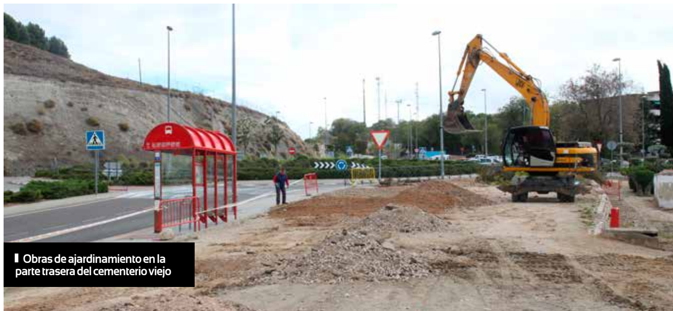
▮ Obras de ajardinamiento en la parte trasera del cementerio viejo