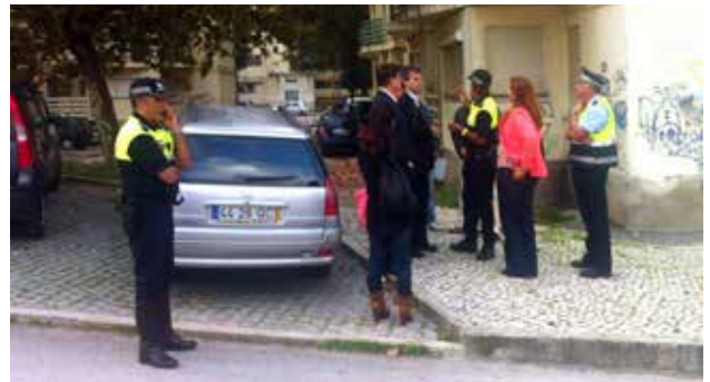
Visita al Barrio Alto de Lisboa

En la página web del Ayuntamiento de Arganda ( www.ayto-arganda.es ) se puede consultar toda la información sobre este innovador Proyecto, que tiene como instituciones colaboradoras al Instituto Internacional de Innovación en Organización y Desarrollo Social (InNODS), la Associació per a la Creació d'Estudis i Projectes Socials (CEPS), la Universidad Complutense de Madrid, el Programa de Gestión de Barrios de Berlín, el Instituto de Ciencias Sociales de la Universidad de Lisboa y el Instituto Superior de Ciencias Policiales y de Seguridad Interna de la Policía Nacional de Portugal y la Policía Municipal de Madrid.