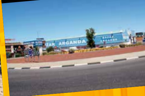
Ajardinamiento rotonda Avda. Madrid / Carrera Toledana / Avda. San Sebastian