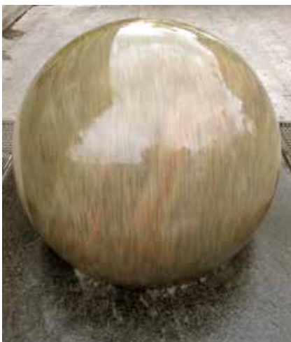
■ Fuente de la Bola