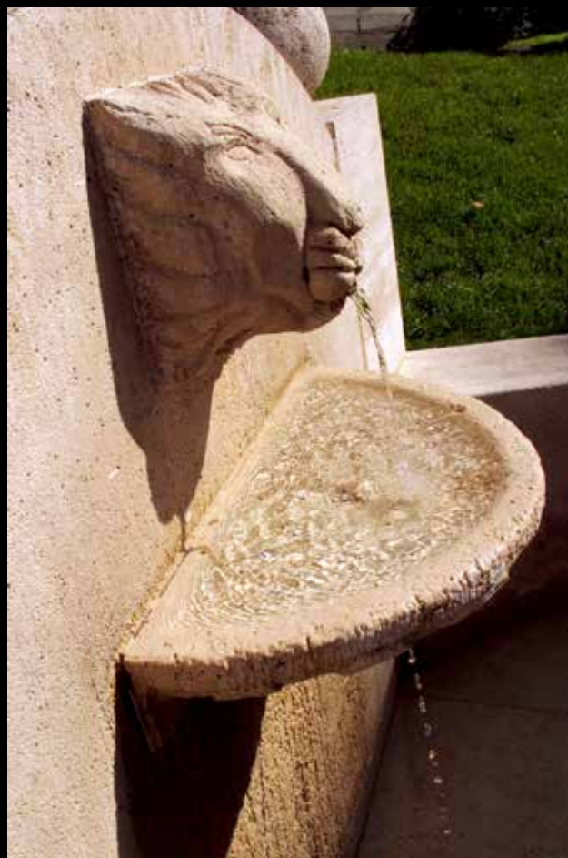
● Fuente de la calle Real frente a la desaparecida Fuente de Leganitos

Aunque se trate de un elemento arquitectónico en busca de una nueva funcionalidad, las fuentes nos siguen fascinando. En un mundo sólido y rígido, el fluido borboteo de los chorros es una invitación constante a la trasgresión. La proximidad de niños y fuentes es una ecuación que siempre genera y generará el mismo resultado: el grito atribulado del adulto recordando que no tiene ropa para cambiarse.