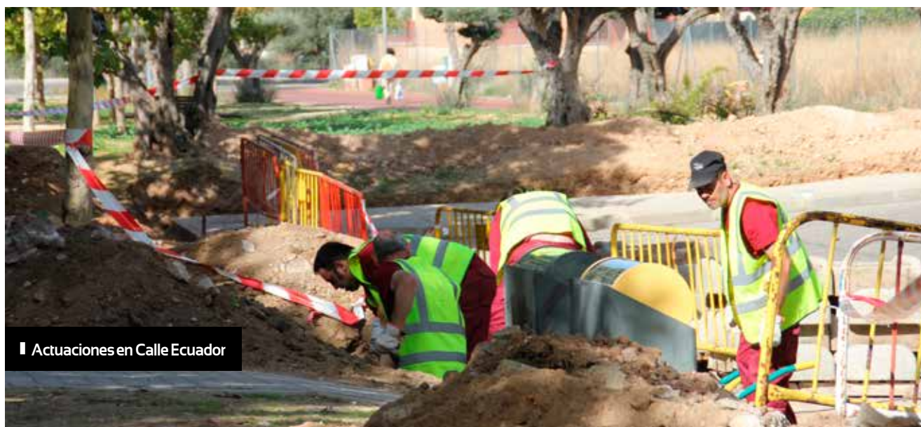
▮ Actuaciones en Calle Ecuador