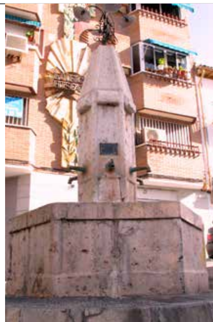
■ Fuente de los Seis Caños

A finales del siglo XIX y principios del XX, las fuentes de Arganda eran elementos funcionales y sociales, ya que servían como lugares de encuentro y conversación. Una fuente era un oasis donde calmar la sed, refrescarse y también donde disfrutar del relajante sonido del agua en un tiempo en el que la ciudad no era tan ruidosa.