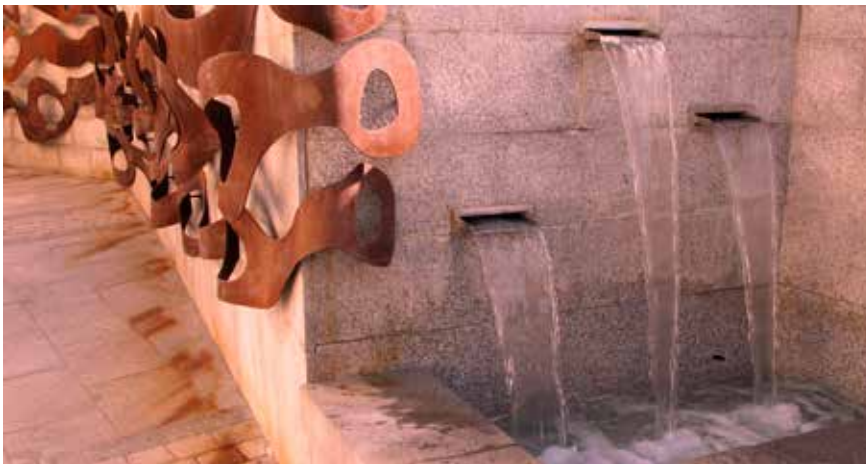
■ Metáfora del mar en la Fuente de la calle Silos