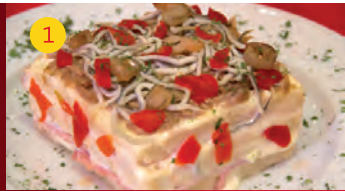
1 Mateo Tapas C/ MARÍA ZAVAS, 2 LOC. 5 Tapa: PASTEL FRÍO RELLENO DE GULAS Y GAMBAS