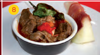
8 El Casino C/ REAL, 32 Tapa: NIDO DE RAGUT CON MELÓN Y JAMÓN