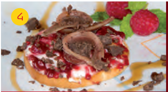
4 Salvi Tapas CTRA. LOECHES, 37 LOC. 1 Tapa: DULCE DE ANCHOA