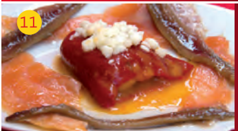
11 La Bocatería AV. DEL EJÉRCITO, 3 LOC. 15 Tapa: PIMIENTO RELLENO DE BACALAO Y GAMBAS SOBRE CAMA DE SALMÓN Y ANCHOAS