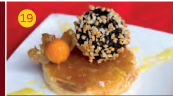
19 Cafetería Askar AV. DEL EJÉRCITO, 28 Tapa: CROCANTI DE MORCILLA RELLENA DE DÁTIL SOBRE TOSTA DE CEBOLLA CONFITADA CON SALSA DE NARANJA Y PERLA DE FRUTA