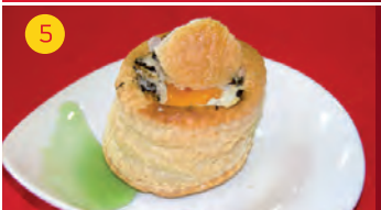
5 Caf. Azcaray CTRA. LOECHES, 1 Tapa: NIDO DE JAMÓN