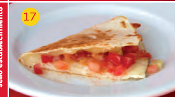
17 Los Villares Bar AV. DE LOS VILLARES, 1 Tapa: QUESADILLA CON TOMATE Y AJO