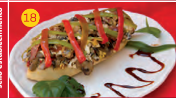
18 Los Toreros Caf. C/ JUAN XXIII, 7 Tapa: TIERRA Y CORRAL