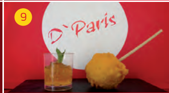
9 D`Paris PLZ. COLÓN, 7 Tapa: PIRULETA EN TEMPURA DE GARBANZO Y CARNE MECHADA CON CHUPITO DE CONSOMÉ GUILLÉ