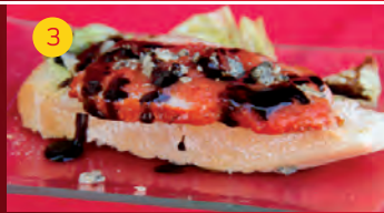
3 Cerv. San Roque C/ REAL, 80 Tapa: LOMO DE CORZO A GRATÉN CON HOJA DE ROBLE