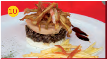
10 Rte. Venecia C/ JUAN DE LA CIERVA, 31 Tapa: BOCADITO DE PASIÓN