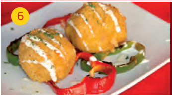
6 Cerv. El Molino C/ REAL, 100 Tapa: BOLITA DE PATATA RELLENA