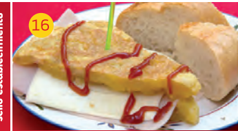
16 Pool AV. DEL EJÉRCITO, 3 LOC. 14 Tapa: MIXTO ESPAÑOL