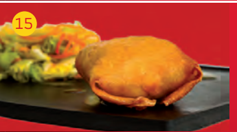
15 La Almazara AV. DE LA HAYA, 8 Tapa: HUEVOS FRITOS CON PATATA ALMAZARA