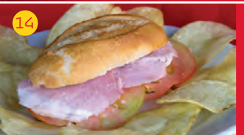
14 Piccolo Cafetería AV. DEL EJÉRCITO, 3 Tapa: LA PULGA LACÓN