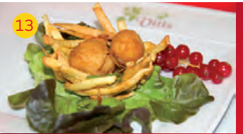
13 Rte. Asador Vitis C/SAN MARTÍN DE LA VEGA, 16 Tapa: NIDO SORPRESA