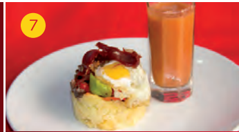
7 Rte. La Tertulia C/ TIENDAS, 6 Tapa: TAPA ALPUJARREÑA CON SORBETE DE NARANJA