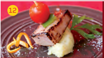
12 Mesón El Labrador C/ REAL, 30 Tapa: PECADO