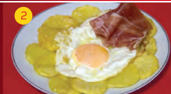
2 Caf. Carachi CTRA. LOECHES, 8 (C.C EL ZOCO) Tapa: TAPA CARACHI