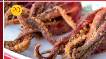
20 Fidalgo Cervecería AV. DEL EJÉRCITO, 5 Tapa: CHOPITOS FIDALGO